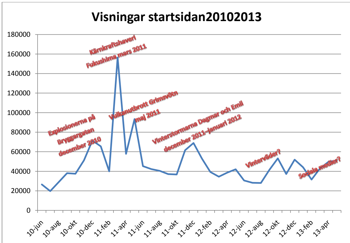
Antalet visningar av Krisinformation.se:s startsida maj 2010-juni 2013.

På Twitter delades dock ett annat VMA mest (28 retweets), det om en brand i Länna industriområde den 7 juni.